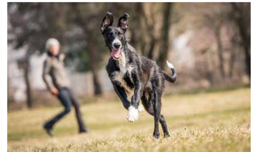
Gutes Training macht beiden Freude: Hund und Halter.

Direkte Konfrontation, wie beispielsweise erzwungenes Abgeben eines Gegenstandes oder Schlagen bzw. Treten des Hundes, führte in einer Studie von M. E. Herron in 30 bis 40 Prozent der Fälle zu aggressi-