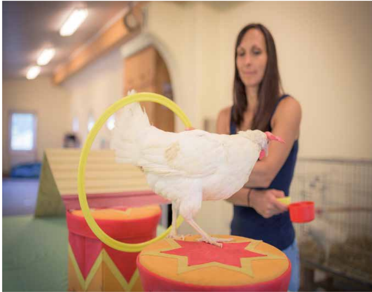
In insgesamt fünf Hühnermodulen verfeinern die TOP-Trainer ihre Fertigkeiten - das kommt auch den Hunden zugute.

WIE EINE GRUPPE TIERTRAINER GEWALTFREIES TRAINING VORANBRINGEN WILL