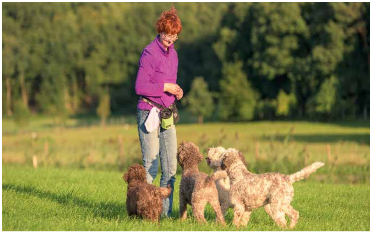
Das Training mehrerer Hunde gleichzeitig ist eine Herausforderung: Mit einem guten Trainingsplan ist auch das machbar.

vem Verhalten. Und selbst indirekte Konfrontation, wie beispielsweise „Nein“ schreien oder den Hund mit Wasser bespritzen lösten in 15 bis 20 Prozent der Hunde Aggressionsverhalten aus (3) .